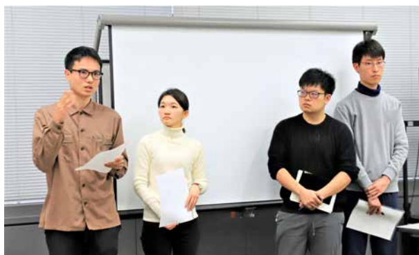
日頃考えていることを発表する大学生たち