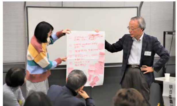
親子(?)ほどの年齢差のある二人で発表