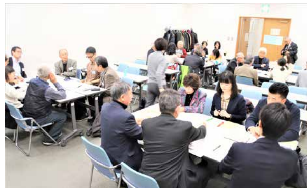
4グループに分かれての提案づくり