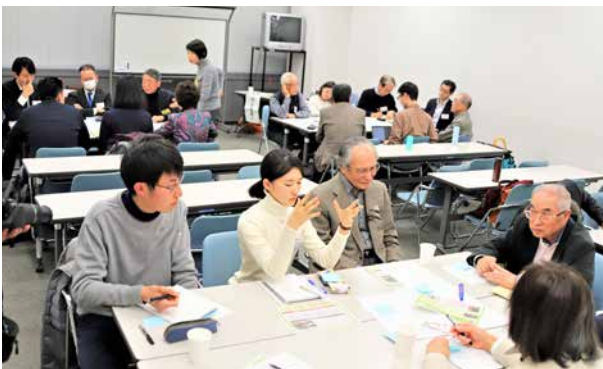
若者の話にも耳を傾ける